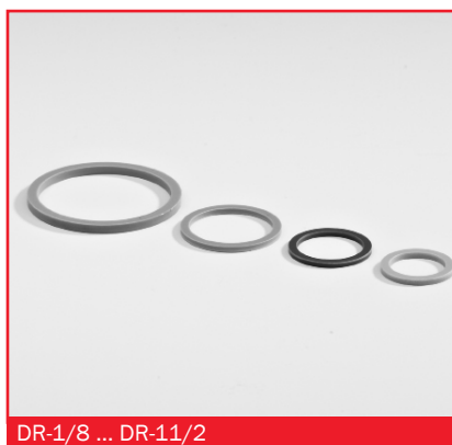
DR-1/8 ... DR-11/2

- уплотнение ниппелей и других соединительных элементов