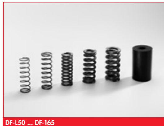
DF-L50 ... DF-165