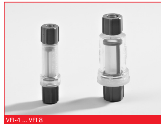
VFI-4 ... VFI 8