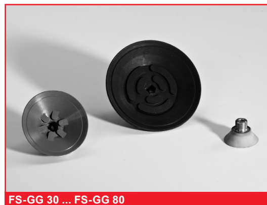
FS-GG 30 ... FS-GG 80